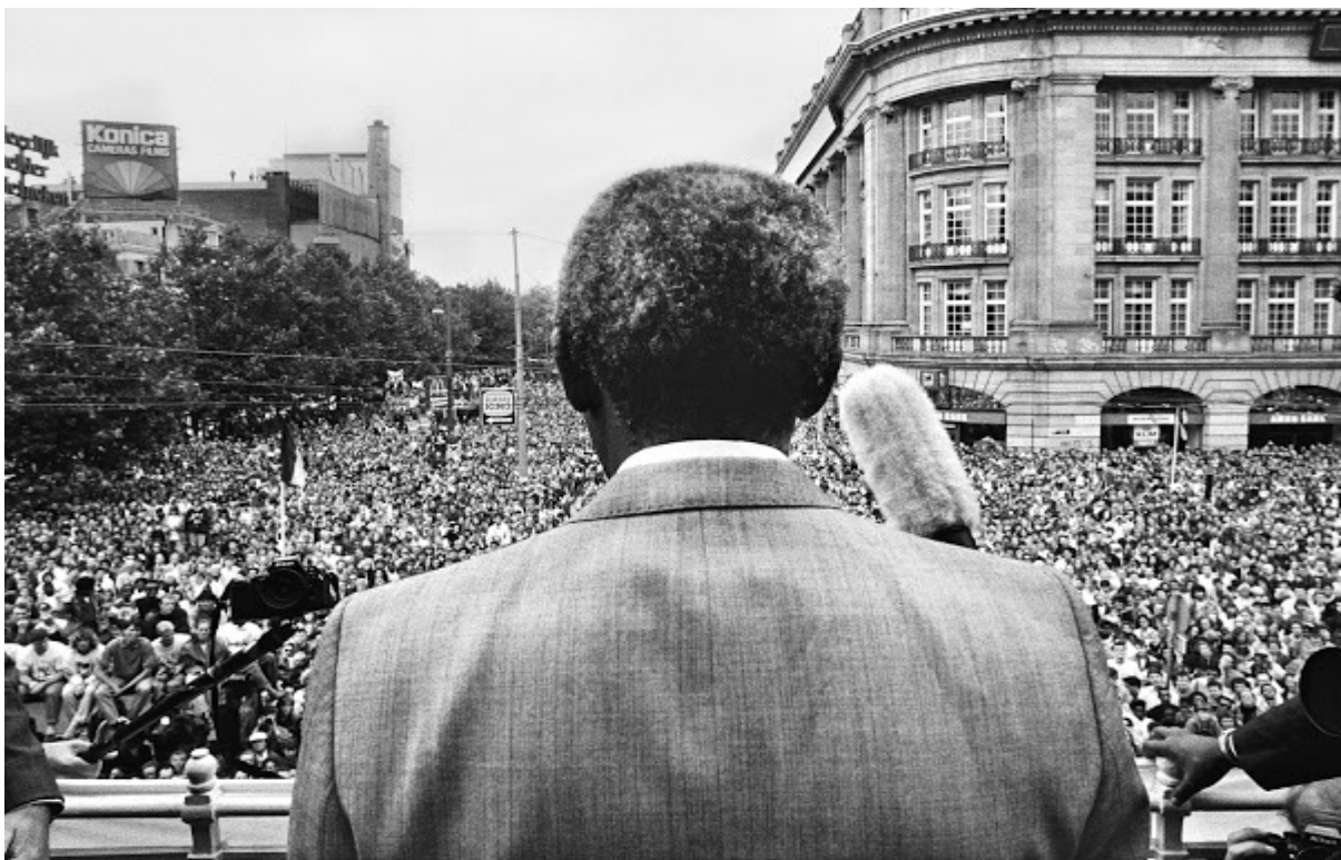
Nelson Mandela in 1990 op het Leidseplein Amsterdam

→ Symposium Good Hope for a new generation – Change in South Africa and The Netherlands, with Adriaan van Dis and Antjie Krog on 5 April