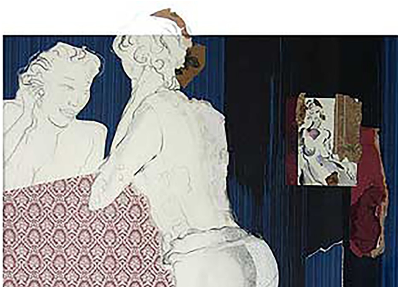
De kunstenaar van Extaze 19 is Wendela de Vries, uitsnede uit 'Roosje', gemengde techniek.

Op 6 oktober staat de presentatie Extaze 19 op het programma, een nummer over vrouwen in de Nederlandstalige literatuur die baanbrekend zijn geweest. Over deze avond, die zal plaatsvinden in de Houtrustkerk in Den Haag (hoek Houtrustweg/Beeklaan), volgt nog nadere informatie